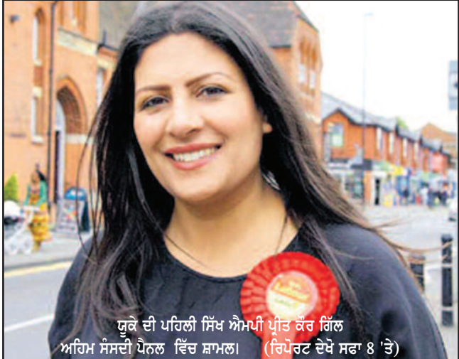
ਯੂਕੇ ਦੀ ਪਹਿਲੀ ਸਿੱਖ ਐਮਪੀ ਪ੍ਰੀਤ ਕੌਰ ਗਿੱਲ ਅਹਿਮ ਸੰਸਦੀ ਪੈਨਲ ਵਿੱਚ ਸ਼ਾਮਲ। (ਰਿਪੋਰਟ ਦੇਖੋ ਸਫ਼ਾ 8 'ਤੇ)

ਮੁਤਾਬਕ ਮਾਇਆਵਤੀ ਦੇ ਅਸਤੀਫ਼ੇ ਨੂੰ ਸਵੀਕਾਰ ਕਰਨ ਦਾ ਫ਼ੈਸਲਾ ਚੇਅਰਮੈਨ ਦੇ ਹੱਥ ਹੈ। ਫਾਰਮੈਟ ਮੁਤਾਬਕ ਅਸਤੀਫ਼ਾ ਪੱਤਰ ਸੰਖੇਪ ਹੋਣਾ ਚਾਹੀਦਾ ਹੈ ਅਤੇ ਇਸ ਵਿੱਚ ਕਾਰਨ ਨਹੀਂ ਦੱਸੇ ਜਾਣੇ ਚਾਹੀਦੇ। ਇਸ ਤੋਂ ਪਹਿਲਾਂ ਰਾਜ ਸਭਾ ਵਿੱਚ ਗੱਲ ਕਹਿਣ ਲਈ ਮਿਲੇ ਤਿੰਨ ਮਿੰਟਾਂ ਤੋਂ ਵੱਧ ਸਮਾਂ ਹੋਣ 'ਤੇ ਉਪ ਸਭਾਪਤੀ ਪੀ ਜੇ ਕੁਰੀਅਨ ਵੱਲੋਂ ਤਕਰੀਰ ਸਮੇਟਣ ਲਈ ਕਹਿਣ ਉੱਤੇ ਗੁੱਸੇ ਵਿੱਚ ਆਈ ਮਾਇਆਵਤੀ ਨੇ ਕਿਹਾ, 'ਮੈਂ ਰਾਜ ਸਭਾ ਤੋਂ ਅਸਤੀਫ਼ਾ ਦੇ ਦੇਵਾਂਗੀ।' ਮਾਇਆਵਤੀ ਨੇ ਸ੍ਰੀ ਕੁਰੀਅਨ ਨਾਲ ਬਹਿਸਦਿਆਂ ਕਿਹਾ ਕਿ ਉਸ ਨੂੰ ਆਪਣੇ 'ਸਮਾਜ' ਤੇ ਦਲਿਤਾਂ ਦੇ ਮੁੱਦੇ ਉਠਾਉਣ ਤੋਂ ਕਿਵੇਂ ਰੋਕਿਆ ਜਾ ਸਕਦਾ ਹੈ। ਉਨ੍ਹਾਂ ਕਿਹਾ, 'ਮੈਂ ਹਾਲੇ ਗੱਲ ਪੂਰੀ ਨਹੀਂ ਕੀਤੀ। ਦਲਿਤਾਂ ਉੱਤੇ ਹੋ ਰਹੇ ਅਤਿਆਚਾਰ ਬਾਰੇ ਜੇਕਰ ਮੈਨੂੰ ਆਪਣੇ ਵਿਚਾਰ ਪ੍ਰਗਟਾਉਣ ਦੀ ਆਗਿਆ ਨਹੀਂ ਦਿੱਤੀ ਜਾਂਦੀ ਤਾਂ ਮੈਨੂੰ ਸਦਨ ਵਿੱਚ ਬਣੇ ਰਹਿਣ ਦਾ ਕੋਈ ਨੈਤਿਕ ਅਧਿਕਾਰ ਨਹੀਂ ਹੈ।'