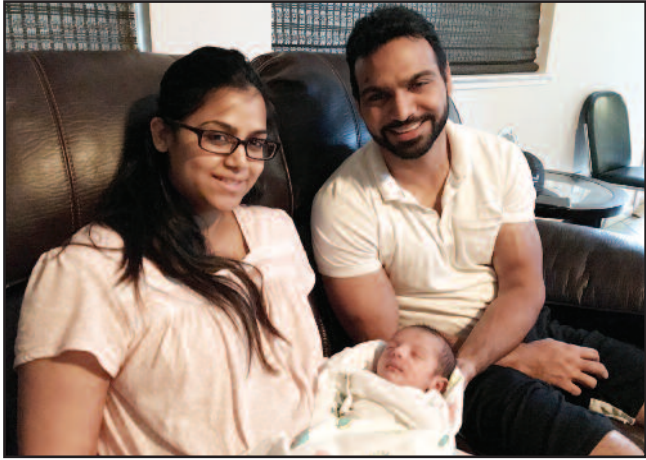
ਨਈਅਰ ਪਰਿਵਾਰ ਘਰ ਲੜਕੇ ਦੀ ਦਾੜ ਨਈਅਰ ਅਤੇ ਚੰਬਰ ਪਰਿਵਾਰਾਂ ਨੂੰ ਹਾਰਦਿਕ ਵਧਾਈ (ਜਨਾਬ ਆਜ਼ਾਦ ਜਲੰਧਰੀ ਵੱਲੋਂ ਵਧਾਈ ਅਤੇ ਤਸਵੀਰਾਂ ਦੇਖੋ ਸਫ਼ਾ 13 'ਤੇ)

ਮੁੱਖ ਸੰਪਾਦਕ : ਪ੍ਰੇਮ ਕੁਮਾਰ ਚੰਬਰ ਸੰਪਾਦਕ : 916-947-8920 ਫੈਕਸ : 916-238-1393 E-mail : deshdoaba@yahoo.com ਸੰਪਾਦਕ : ਤਰਸੇਮ ਜਲੰਧਰੀ